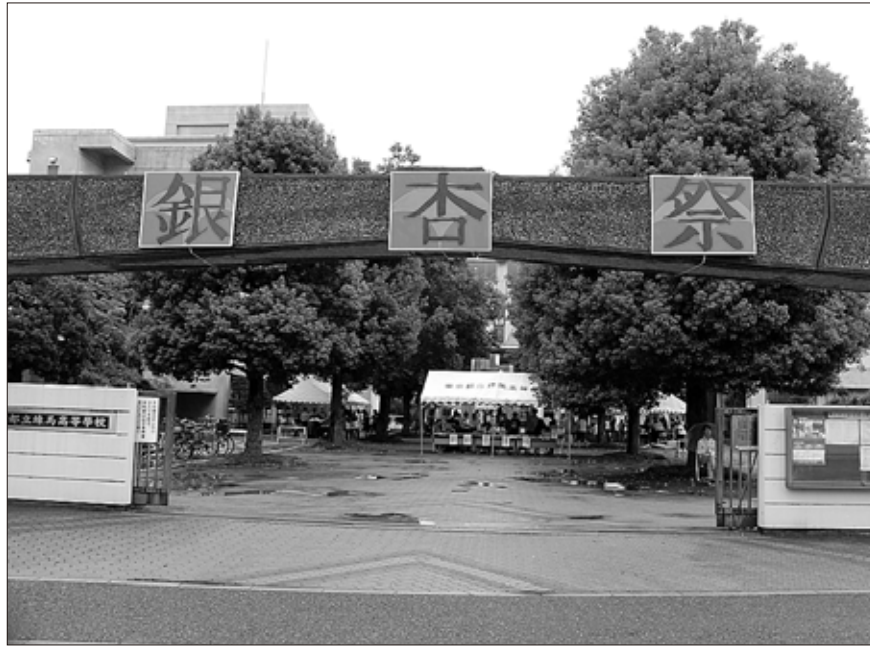
2018年9月15日(土)、16日(日) 練馬高校文化祭(银杏祭)の正門の様子

深い喜びも、深い悲しみも無機質な記号に変換された生活になっていませんか。個人の殻に閉じこもり、不寛容な社会ではないでしょうか。