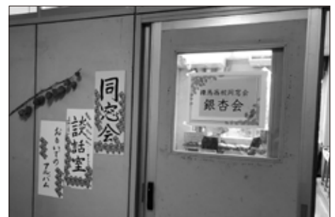
同窓会ブース（入り口）の様子

飲み物の無料提供も大変好評で、両日で300名の想定をはるかに上回り、途中で買い出しが必要になるハプニングもありましたが、多くの方に提供できてうれしかったです。 来年も同窓会は銀杏祭参加を予定しています。皆さんもぜひ銀杏祭にいらしてください。