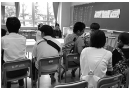
同窓会ブースの様子

在校生の来場者からは、「十年、二十年前の先輩たちの姿から、時代が感じられて楽しい。」という声が上がりました。