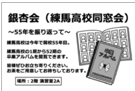
銀杏祭パンフレットに掲載された催し案内の原稿

飲み物の無料提供も大変好評で、両日で300名の想定をはるかに上回り、途中で買い出しが必要になるハプニングもありましたが、多くの方に提供できてうれしかったです。 来年も同窓会は銀杏祭参加を予定しています。皆さんもぜひ銀杏祭にいらしてください。